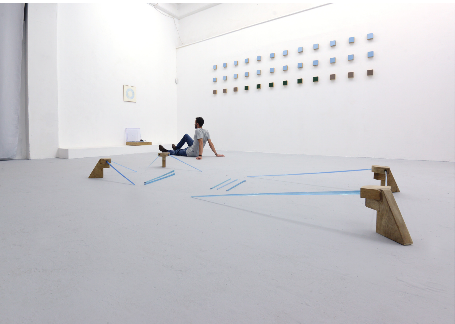
דימוי הצבה מתוך תערוכת בוגרים 2019, 'בן האדם למקום'