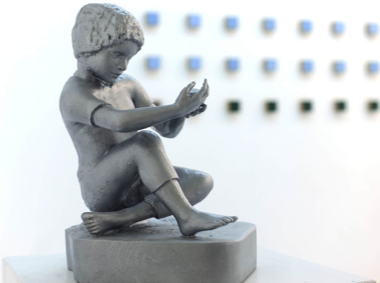
A child looks at the imagination 2018 23X24X38 cm Digital sculpture and 3D printing

ילד מביט אל הדמיון 2018 23X24X38 ס"מ פיסול דיגיטלי והדפסת תלת מימד