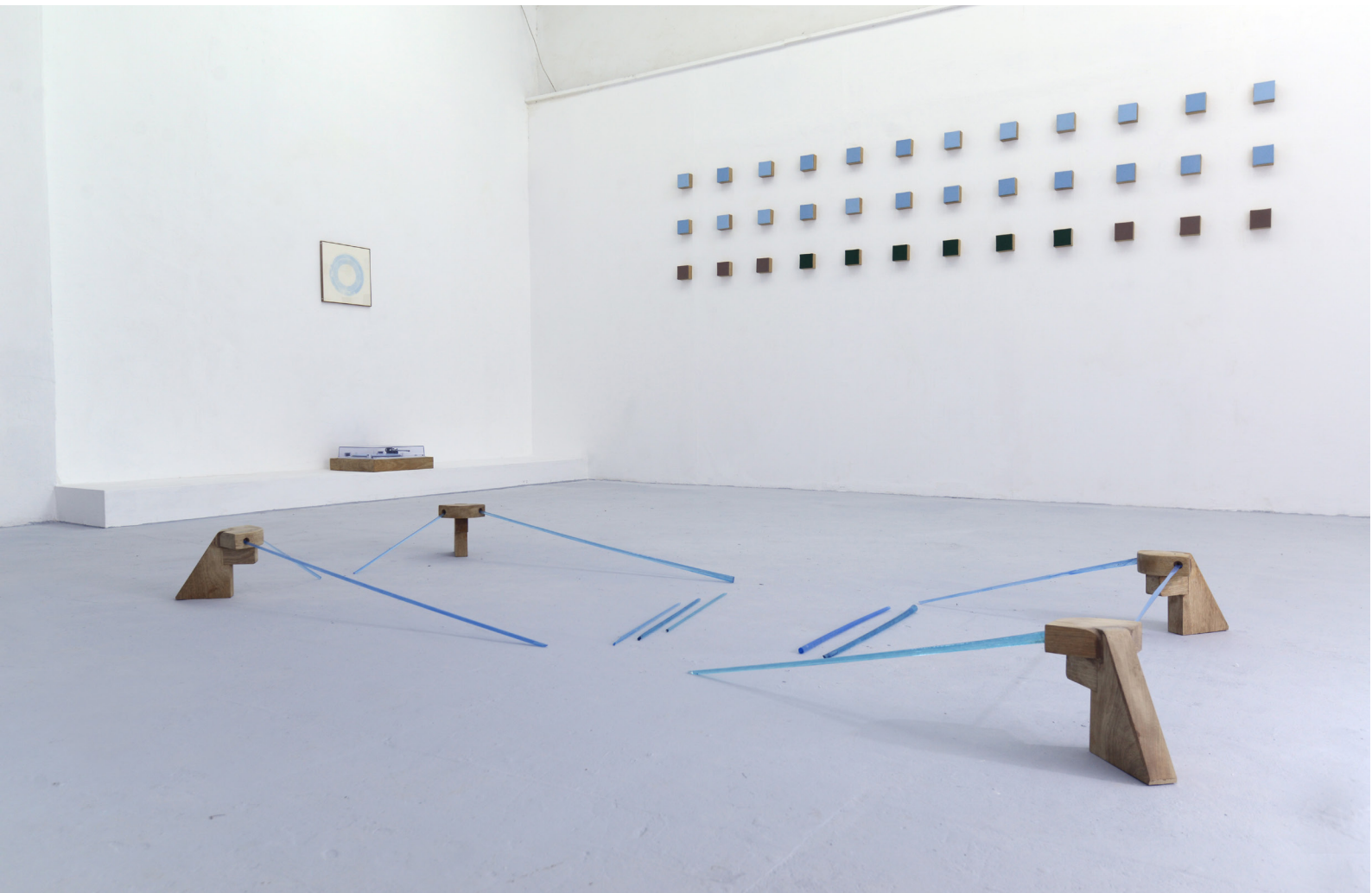
דימוי הצבה מתוך תערוכת בוגרים 2019, 'בן האדם למקום'