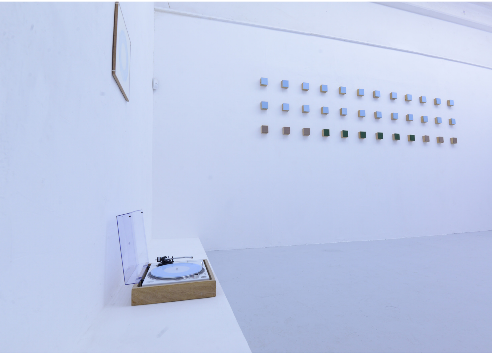
דימוי הצבה מתוך תערוכת בוגרים 2019, 'בן האדם למקום'