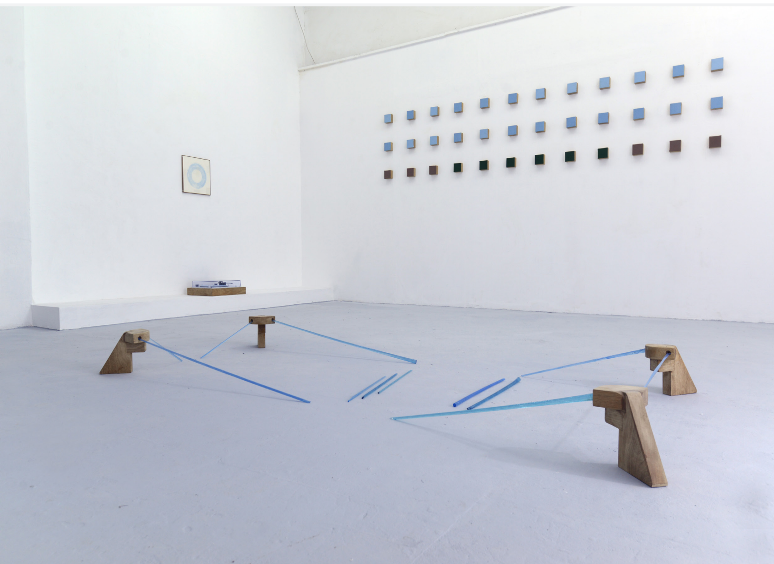
דימוי הצבה מתוך תערוכת בוגרים 2019, 'בן האדם למקום'