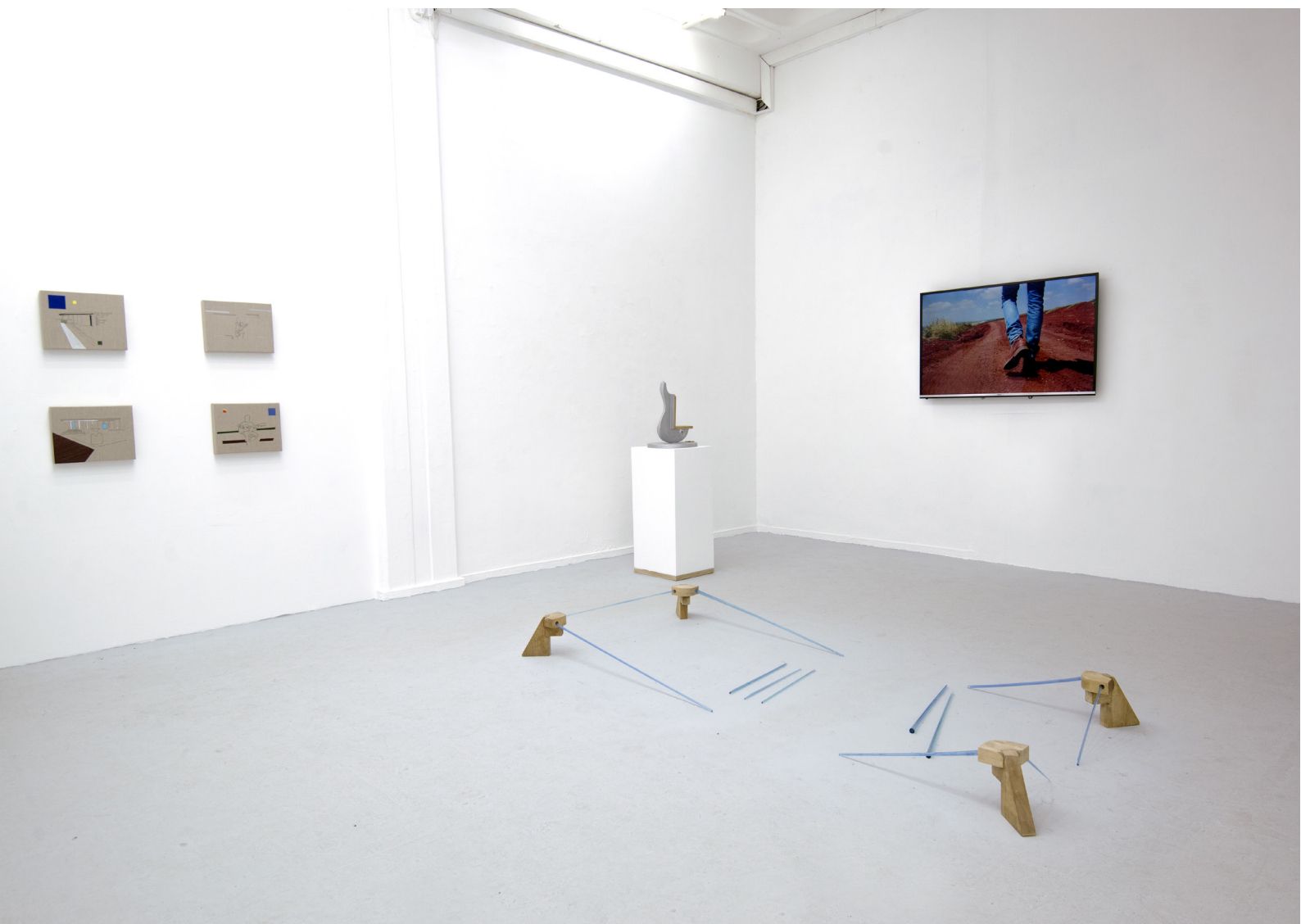
דימוי הצבה מתוך תערוכת בוגרים 2019, 'בן האדם למקום'