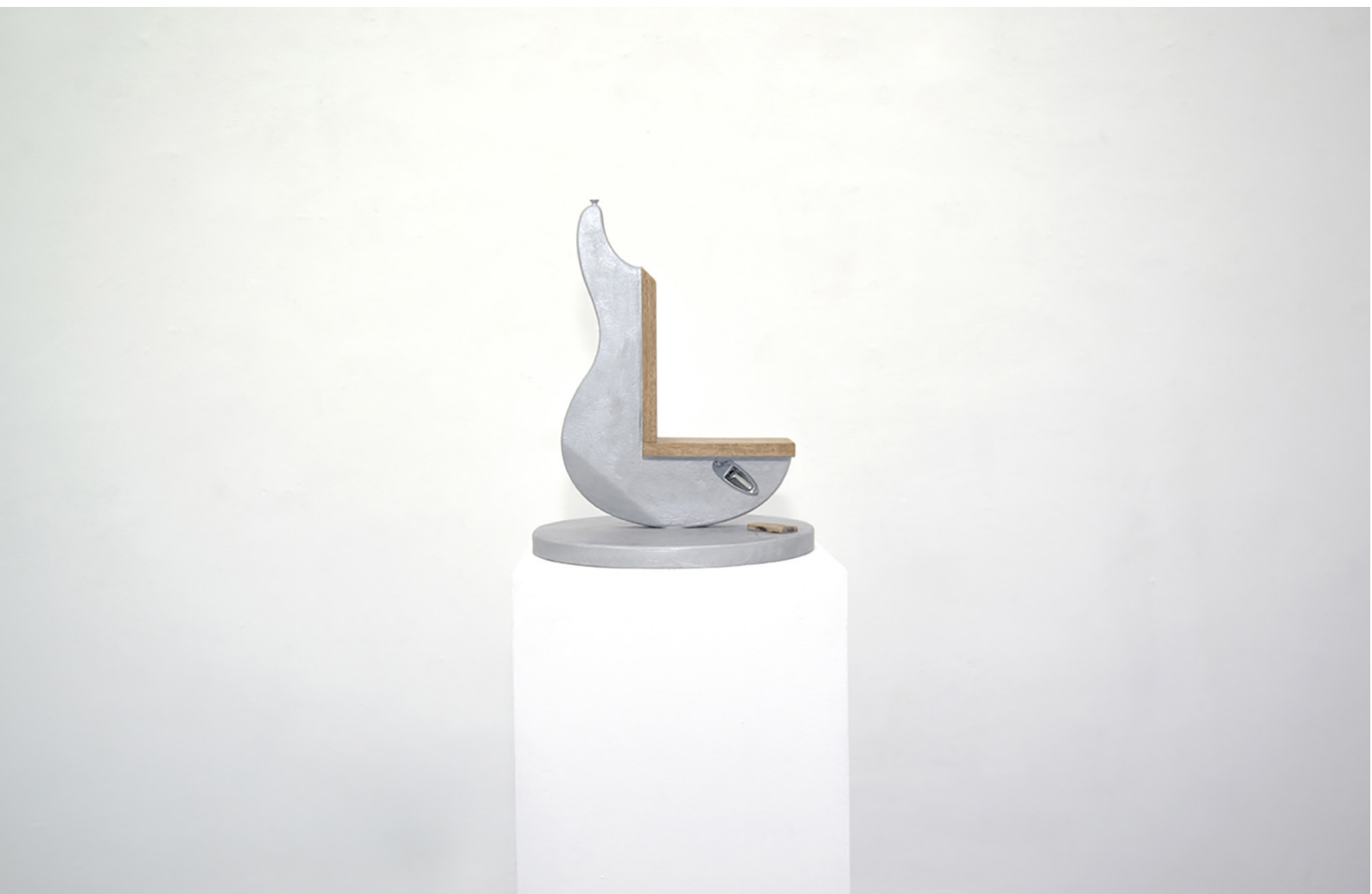
Untitled 2019 43x43x55 cm Mixed technique, readymade, industrial painting, oak wood