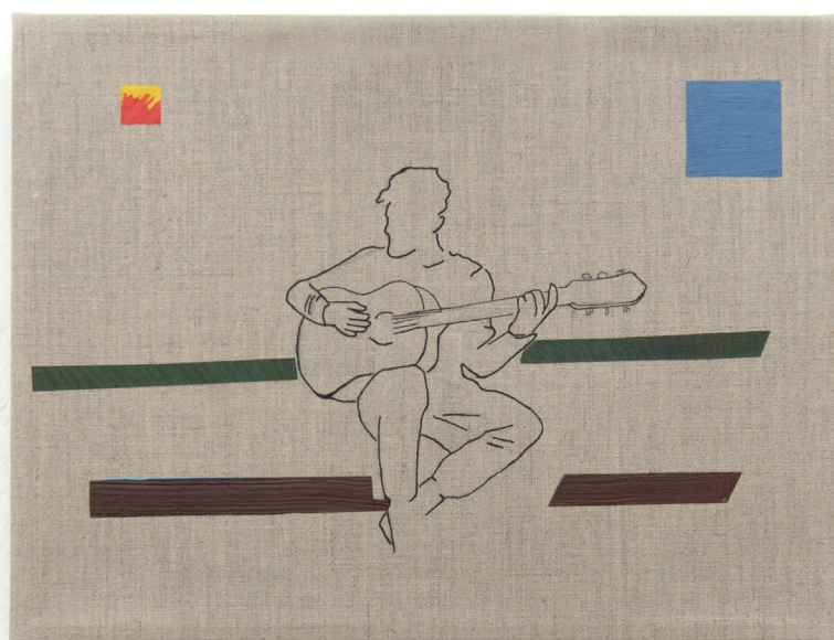
The Spanish Singer 2019 30x40 cm Acrylic and oil painting on linen canvas

הזמר הספרדי 2019 30X40 ס"מ ציור אקריליק ושמן על בד פשתן