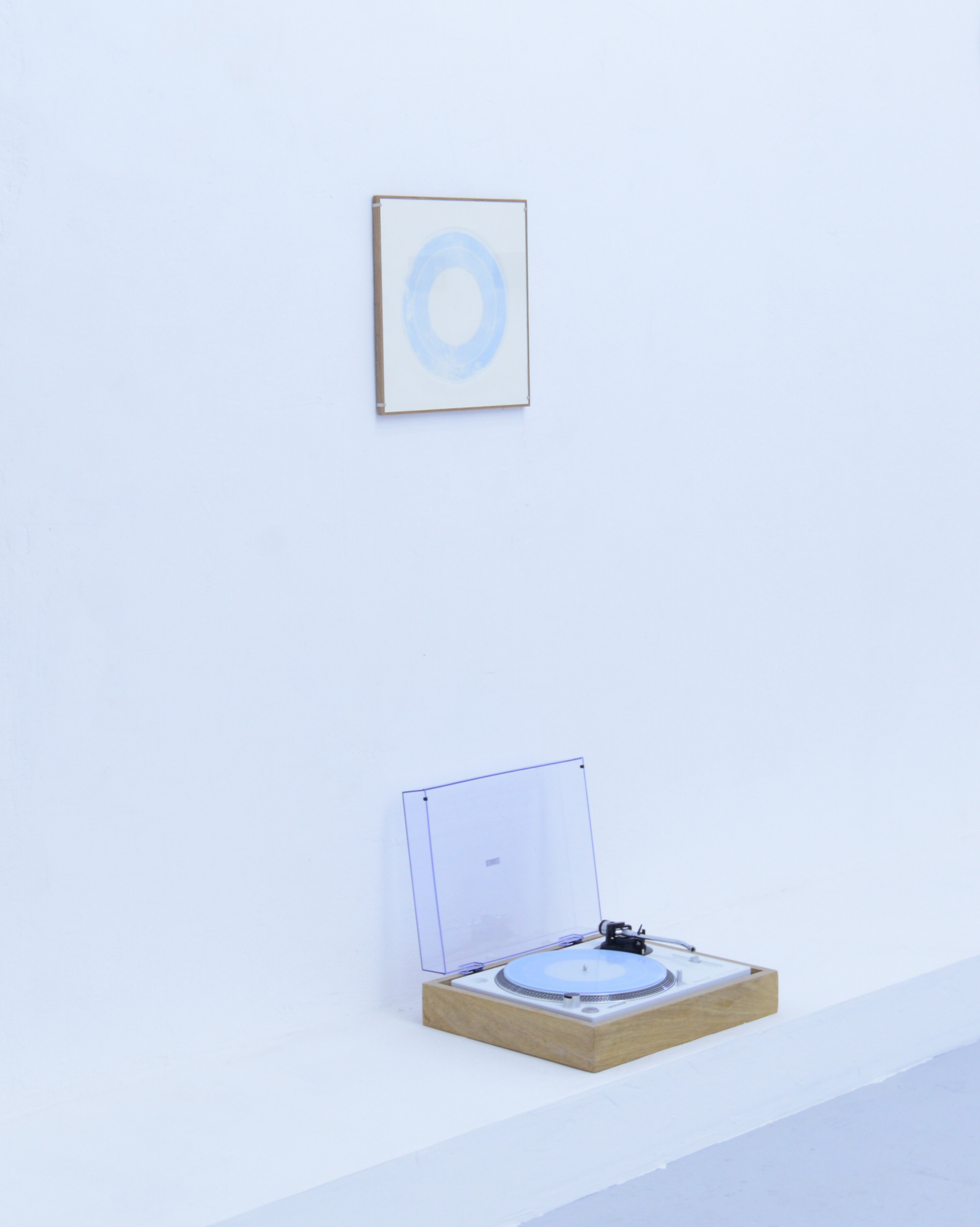
דימוי הצבה מתוך תערוכת בוגרים 2019, 'בן האדם למקום'